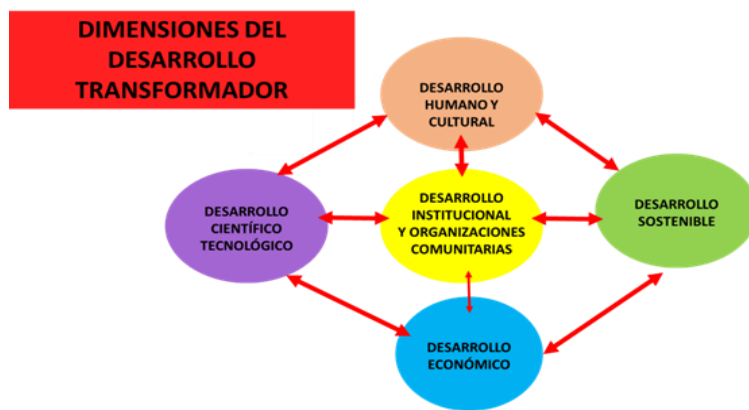
Figura 1 Dimensiones del Desarrollo Transformador

Por lo mencionado, nuestro Plan de Trabajo tendrá cinco Ejes Estructurales que corresponden a cada una de las dimensiones del Desarrollo (Figura 1) y que detallamos en el capítulo 3. Tendrá además un Eje relacionado al combate del crimen organizado , narcotráfico y sus impactos negativos en la sociedad ecuatoriana, porque la inseguridad/delincuencia/violencia presente en los últimos años en nuestro país, se ha convertido en el primer problema que debemos combatir (según lo señala un informe de CEDATOS, figura 2).