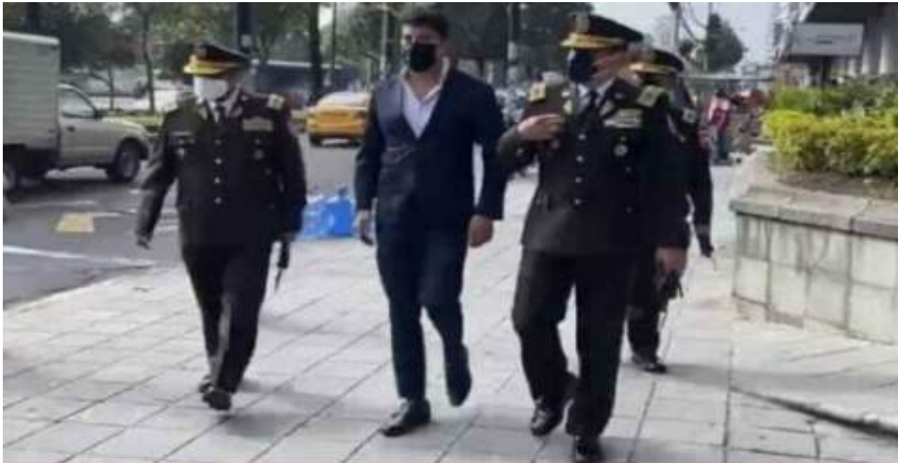
El general de Policía, Víctor Araus (der.) acudió a la Comandancia de Policía, en el norte de Quito, el 9 de diciembre del 2021.

Luego de que la jueza Verónica Medina concediera una acción de protección a favor del general Víctor Araus , él se reintegró a la Policía Nacional.